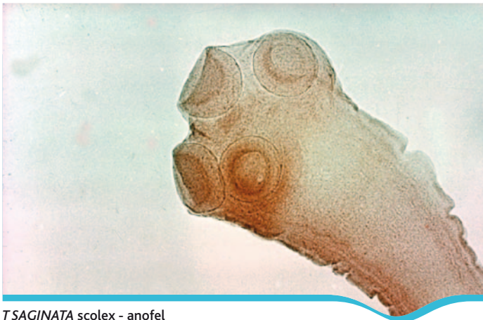
T SAGINATA scolex - anofel

Tænia saginata est un des deux agents responsables du téniasis humain, l'autre étant Tænia solium . C'est un ver plat (classe des Cestoidea , ordre des Cyclophyllidea , famille des Taeniidae ) évoluant sous deux stades : adulte (chez l'hôte définitif (1) ) et larvaire (chez l'hôte intermédiaire (2) ). Il vit dans l'intestin grêle de l'Homme, généralement en un seul exemplaire. Il se présente sous la forme d'un long ruban segmenté de plusieurs mètres (de 4 à 10 m), de couleur blanc jaunâtre, mince à son extrémité antérieure, et qui s'élargit graduellement en allant vers l'extrémité postérieure. Le ver adulte est constitué de trois parties : le scolex (« tête »), qui a l'aspect d'un petit renflement de 1 à 2 mm de diamètre, pourvu de quatre ventouses et dépourvu de crochets ; le cou, partie amincie, qui réunit le scolex au reste du corps et se termine par le strobile qui représente la chaîne de segments ou anneaux, dénommés « proglottis » et mesurant entre 5 et 20 mm de long. Les proglottis âgés et mûrs, vers la fin du strobile, ne sont que des sacs contenant de 50 000 à 80 000 œufs embryonnés ou « embryophores ».